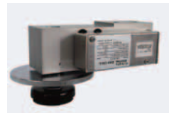
信頼のデジタルロードセル 搭載