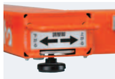
正確な計量を保証する レベルアジャスター (最薄95mm~)