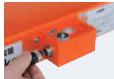
移動にベンリな 脱着式防水コネクタ