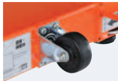
移動用キャスター